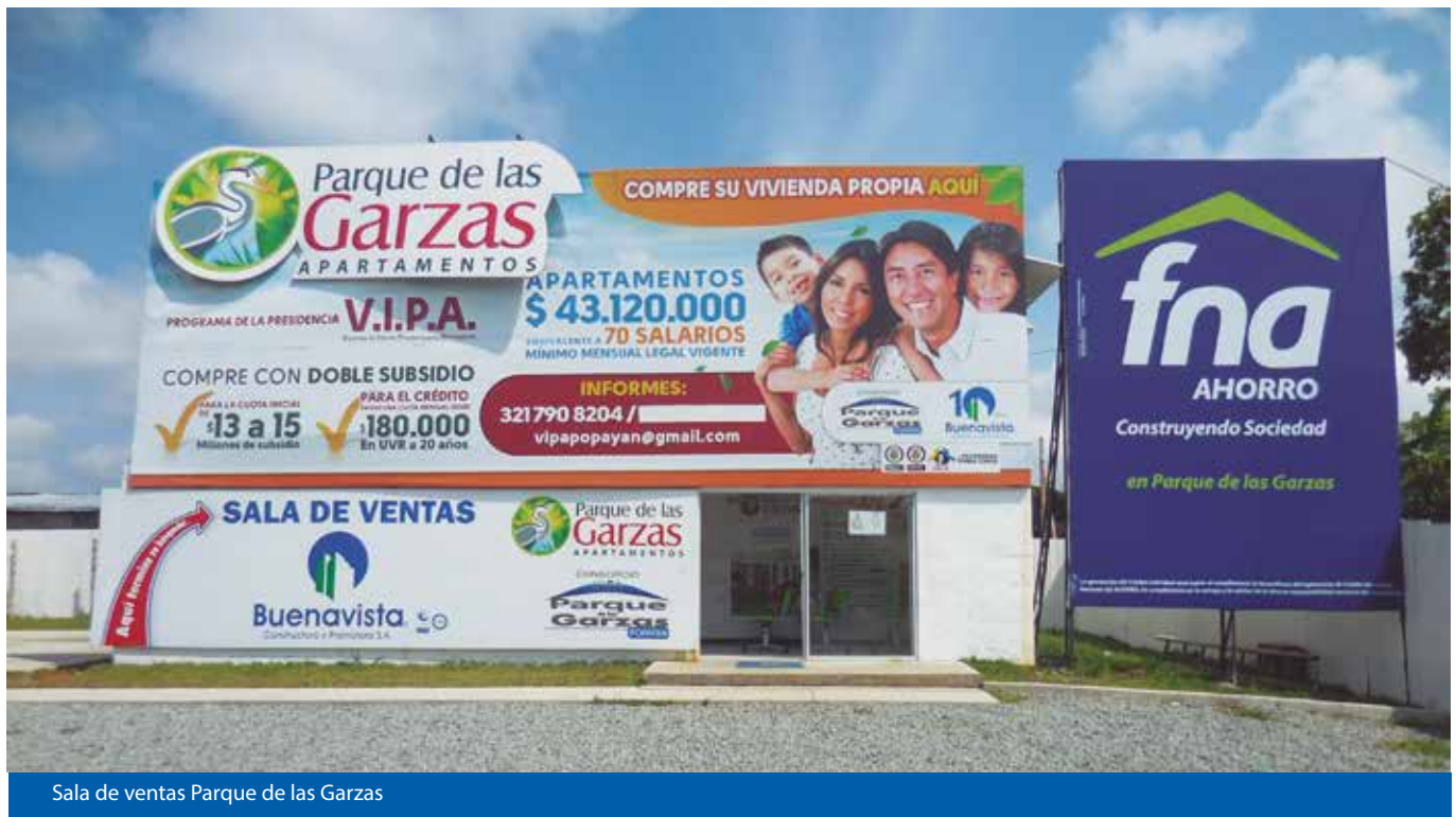
Sala de ventas Parque de las Garzas

También Comfacauca llega directamente a las empresas a través de asesores comerciales, quienes de manera precisa dan a conocer la información.