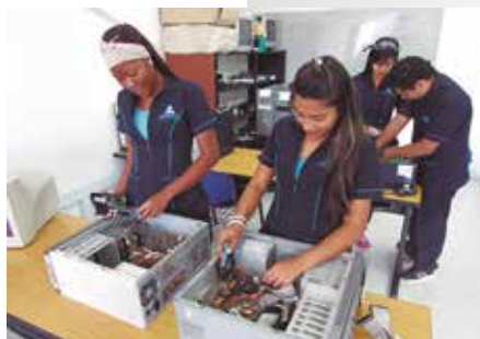
Técnico en sistemas