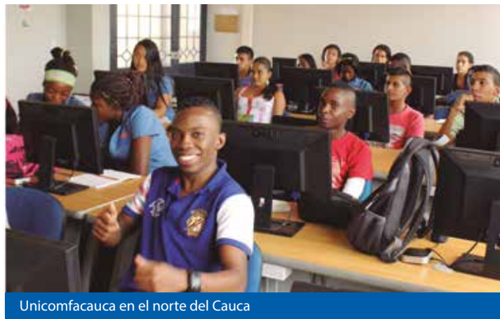
Unicomfacauca en el norte del Cauca

Así, no queda duda que la Corporación Universitaria está comprometida con la formación profesional y con la educación de seres humanos que aporten acertadamente al desarrollo y evolución de los contextos regionales, nacionales y mundiales, siendo parte de importantes equipos de trabajo pero también capaces de generar nuevo conocimiento e innovadoras dinámicas empresariales.