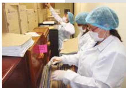
Técnico en Organización de Archivos

aseguramiento y fomento de la calidad de las Instituciones de Formación para el Trabajo y Desarrollo Humano (FTDH) con los siguientes beneficios: