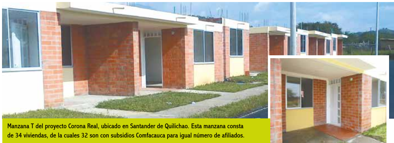
Manzana T del proyecto Corona Real, ubicado en Santander de Quilichao. Esta manzana consta de 34 viviendas, de las cuales 32 son con subsidios Comfacauca para igual número de afiliados.