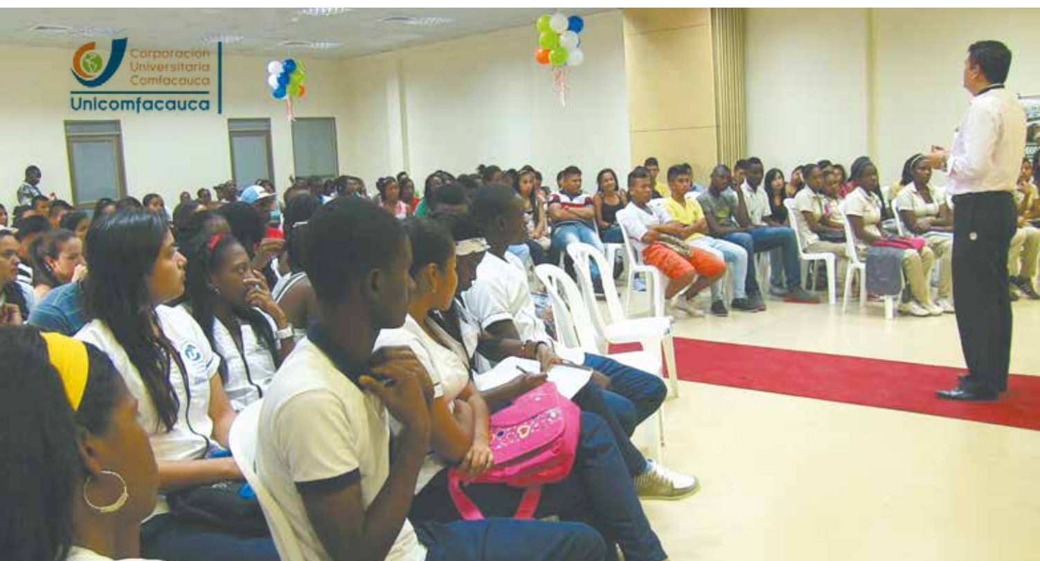
Unicomfacaucá trabaja por la formación integral de los jóvenes en los niveles humano y profesional

Se resalta, también, que más allá de beneficiar a los jóvenes de los 13 municipios del norte del Cauca, desde el proyecto se viene gestando la capacitación para docentes de 27 instituciones educativas, frente al ajuste y rediseño de los proyectos educativos institucionales en su articulación con la educación superior, lo que permitirá que los futuros bachilleres cuenten con un mejor nivel de formación e ingresen con mayores competencias a la educación superior.