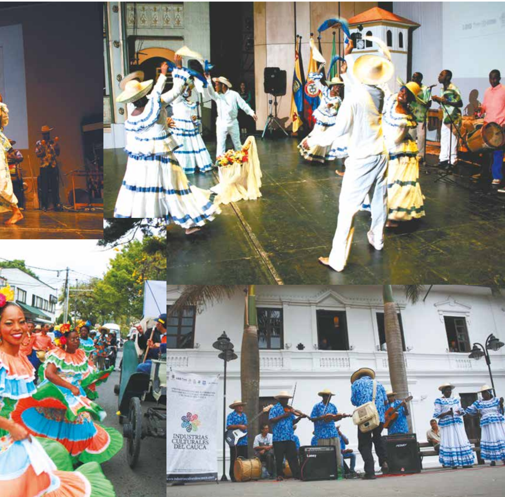
Presentación de la Asociación Folclórica Yoruba, en el acto de cierre