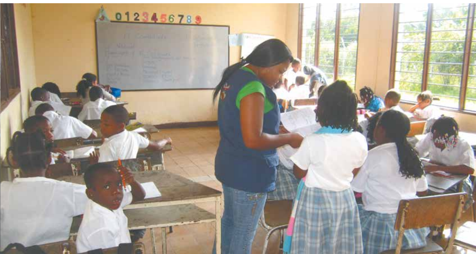
Comfacauca viene desarrollando un proyecto piloto, en dos de las 49 instituciones educativas vinculadas al programa Jornada Escolar Complementaria en el municipio de Popayán, con el propósito de construir un modelo de educación financiera.

que permitan la responsabilidad social, el respeto por los derechos de la niñez, la valoración de las diferencias, el ejercicio de la democracia en el Departamento y el fortalecimiento de las habilidades en los niños, niñas y jóvenes escolarizados, a fin de impulsar iniciativas de formación con aprendizajes significativos para la vida.