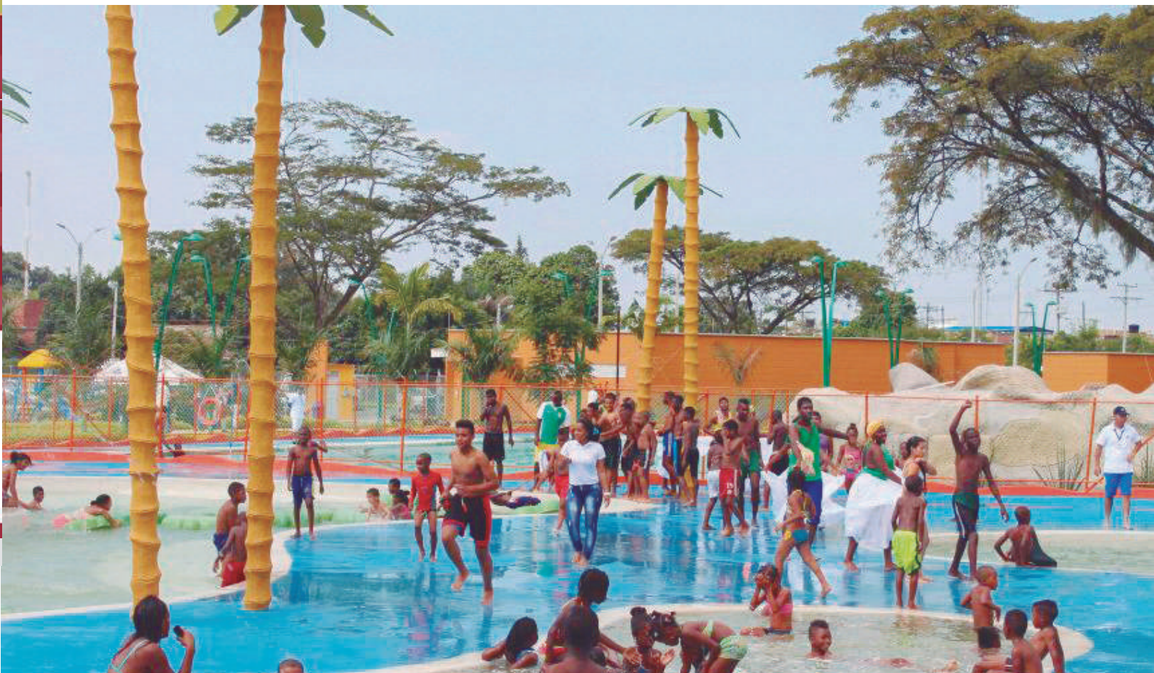
Zona Acuática, inaugurada en diciembre de 2016. Isla del Chontaduro.