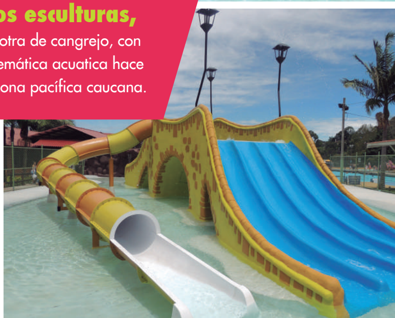
La piscina "Puente del Humilladero", en honor a uno de los más importantes símbolos de Popayán, está adecuada en forma de oasis.

En la piscina para niños se ubicaron dos esculturas, una de caracol y otra de cangrejo, con toboganes. Esta temática acuática hace honor a nuestra zona pacífica caucana.