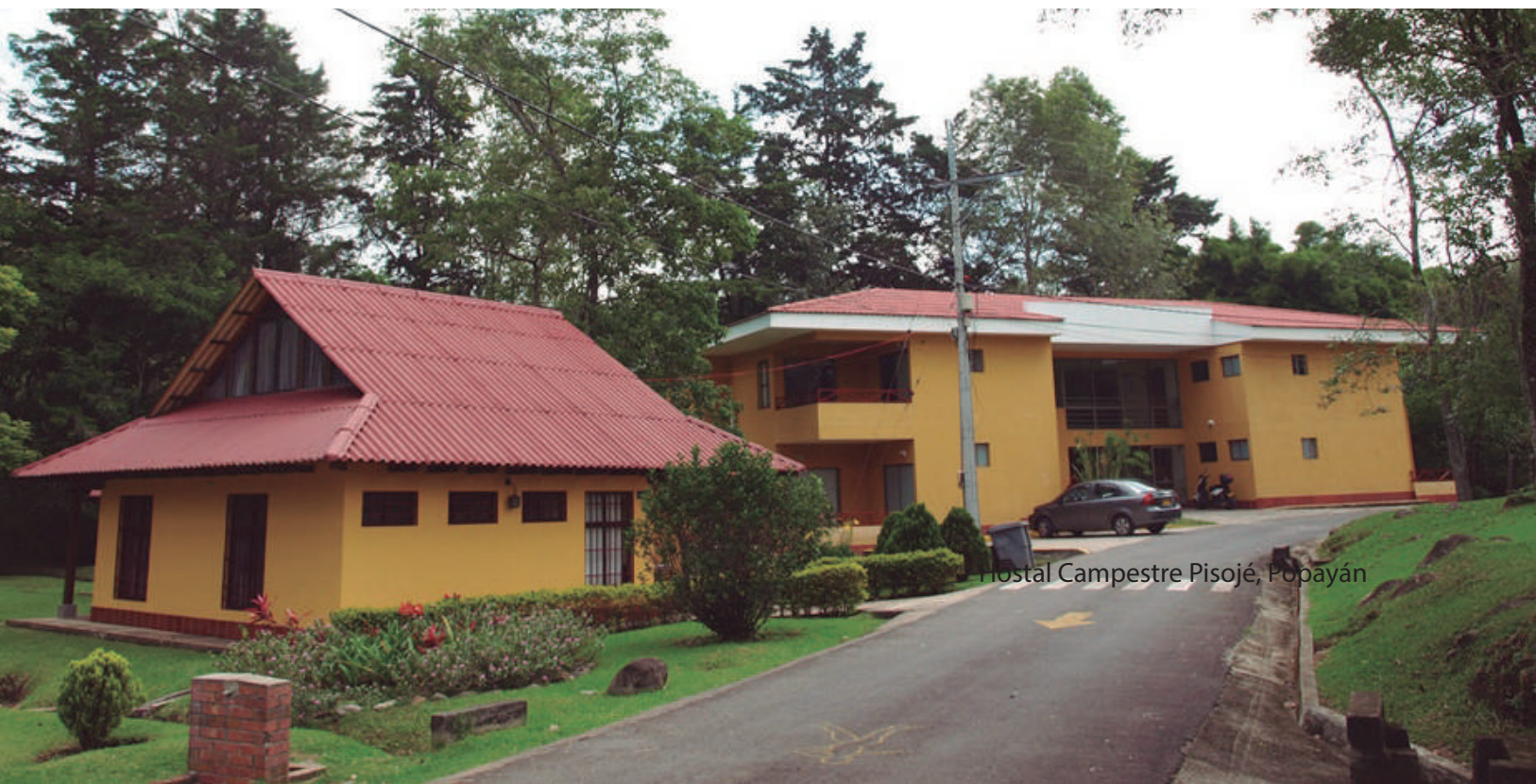
Hostal Campestre Pisoje, Popayán