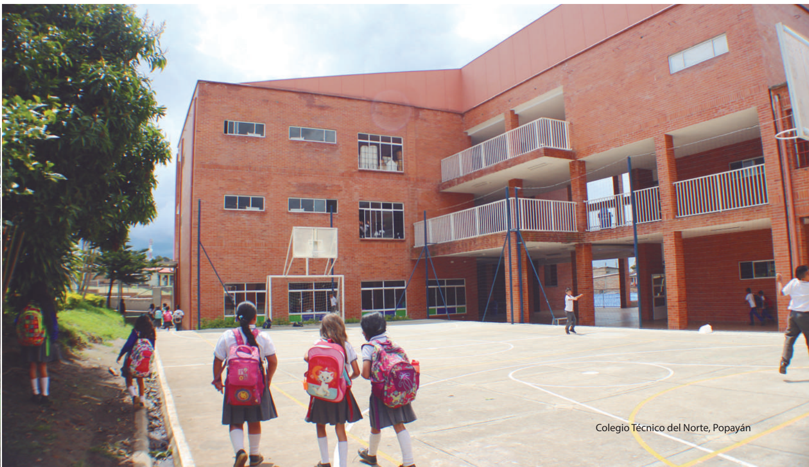
Colegio Técnico del Norte, Popayán