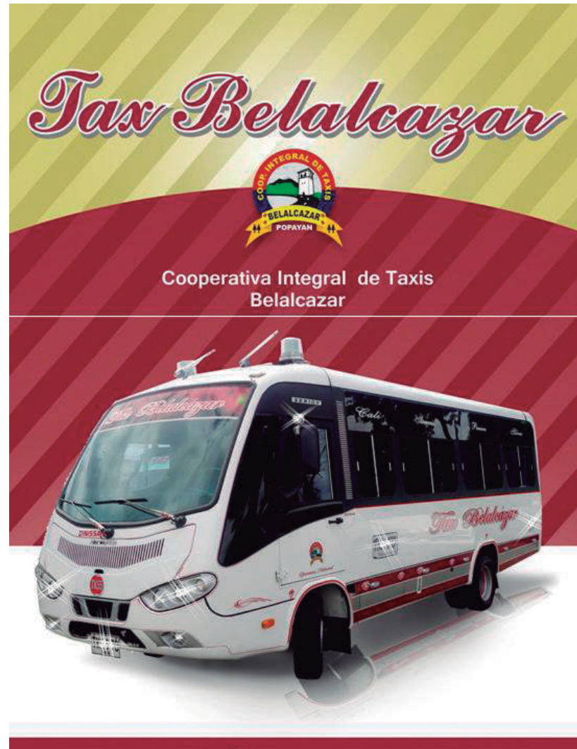
Bus de servicio intermunicipal de Tax Belalcázar.

L.A.P.C. Desde antes de aprobarse la Ley de Seguridad Vial, veníamos en ese proceso, capacitando a los conductores. Es más, Tax Belalcázar es una de las empresas del suroccidente