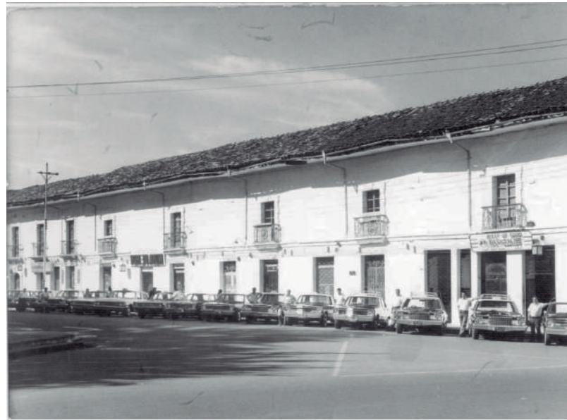
Antiguamente Tax Belalcázar operaba desde el parque Francisco José de Caldas.