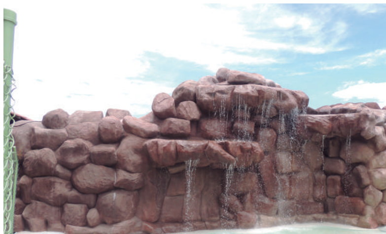
Grandes rocas artificiales que semejan un desierto, por las que se cuelan cascadas decorativas.