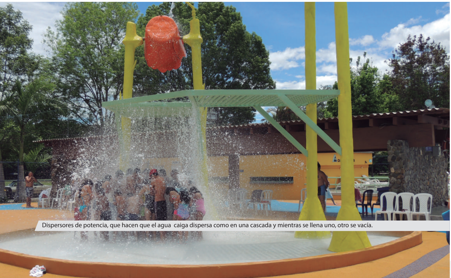
Dispensores de potencia, que hacen que el agua caiga dispersa como en una cascada y mientras se llena uno, otro se vacía.

De verdad, es un centro de diversiones dentro de la piscina de niños, que tiene forma de playa y se entra poco a poco; el agua sube y llega hasta el nivel del piso, es emocionante.