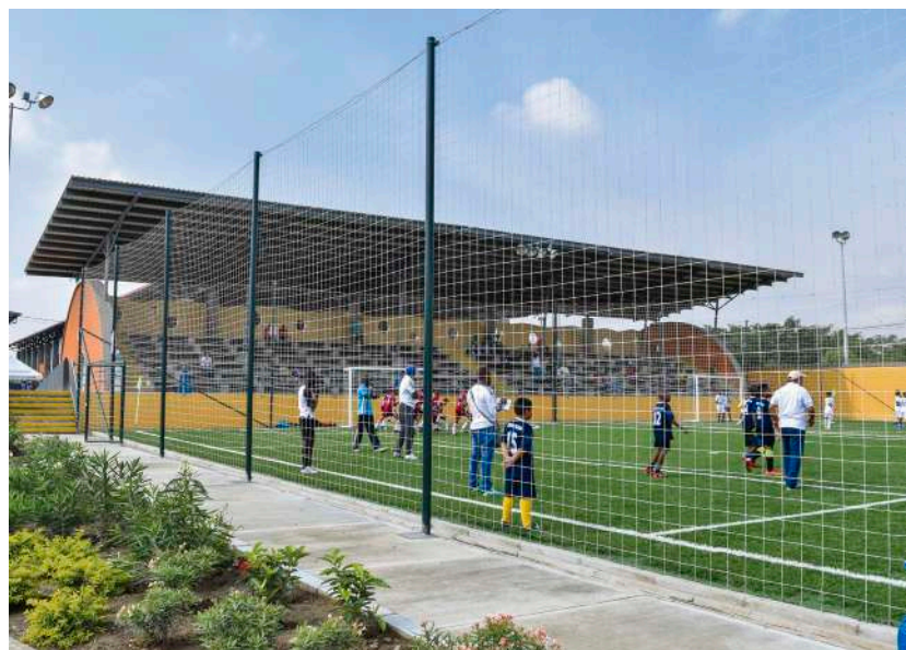
Canchas de fútbol del centro recreativo La Ceiba, en Puerto Tejada.