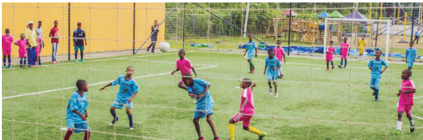
El programa cuenta con los mejores y más seguros escenarios deportivos del norte del Cauca.

La mayor participación es de niños que hacen parte de familias afiliadas de menores ingresos.