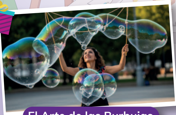
El Arte de las Burbujas