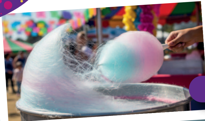
Nubes de Algodón