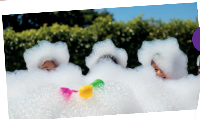
Fiesta de Espuma

¡Diversión garantizada para todos los niños!