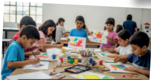
Arte y Color