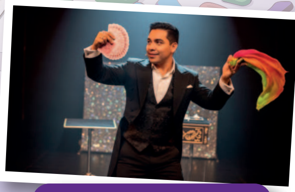
Show de Magia