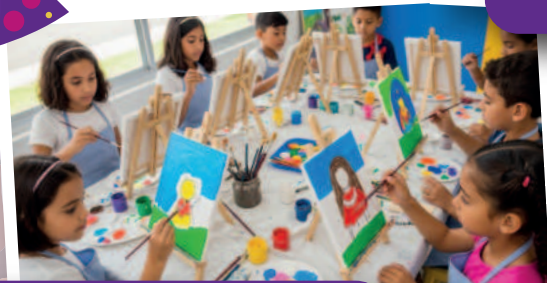
Pintura En Lienzo