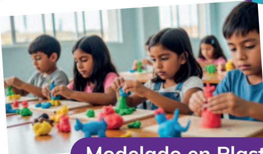
Modelado en Plastilina