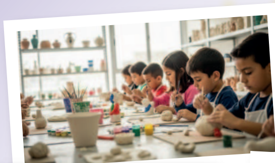
Pintura En Cerámica